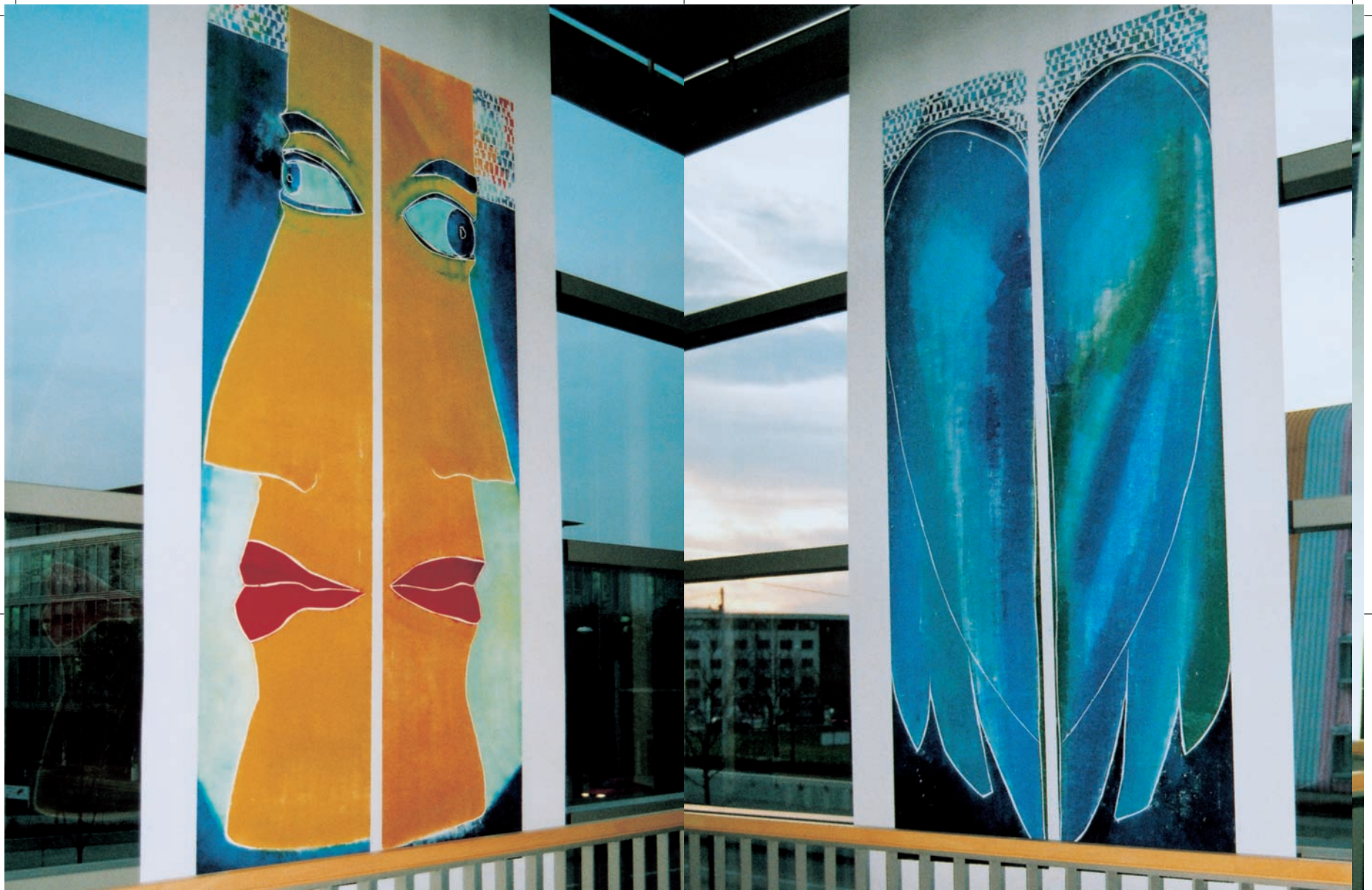
„KopfKopf“, Farbholzschnitt, 240 x 120 cm „FlügelBlau“, Farbholzschnitt, 240 x 120 cm