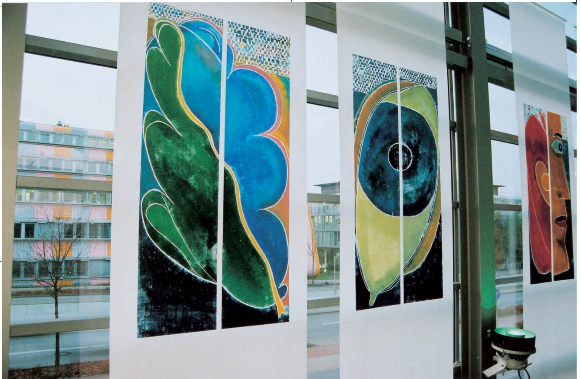
„Blattwolke“, Farbholzschnitt, 240 x 120 cm