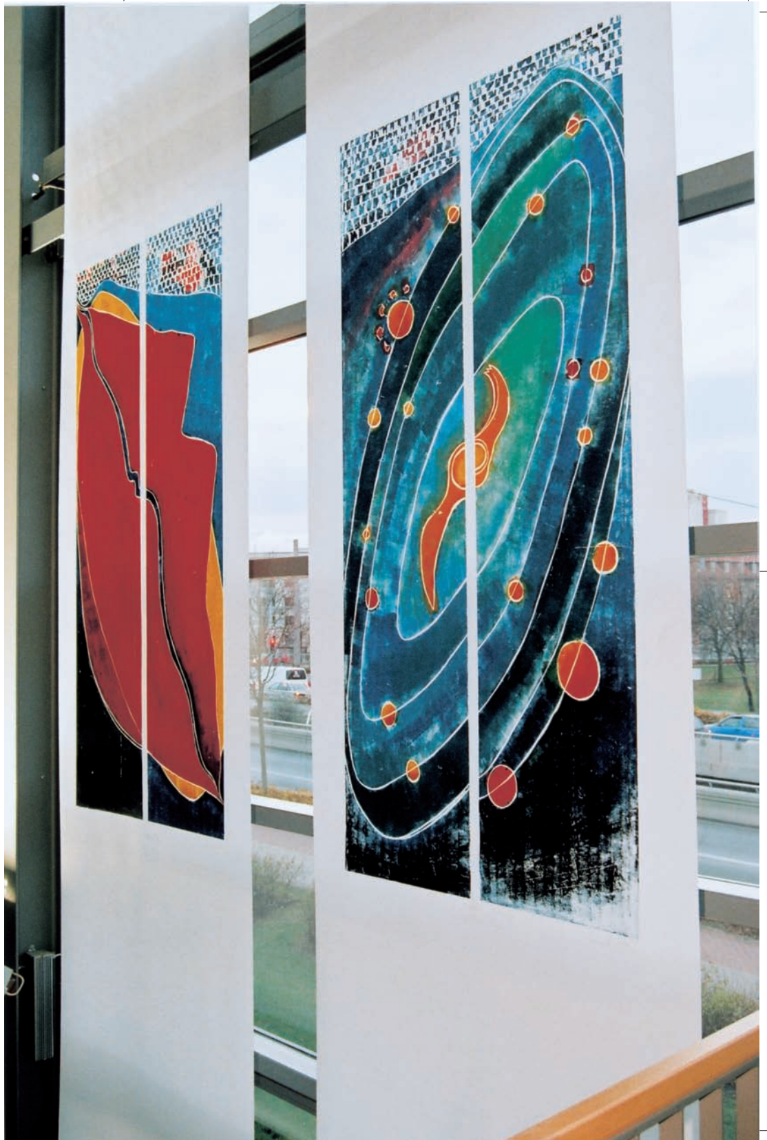
„Mund“, Farbholzschnitt, 240 x 120 cm „Weltall“, Farbholzschnitt, 240 x 120 cm