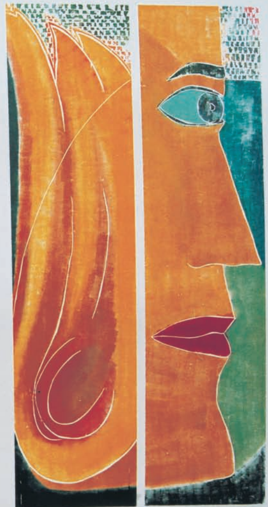
„WeltallOhr“, Farbholzschnitt, 240 x 120 cm