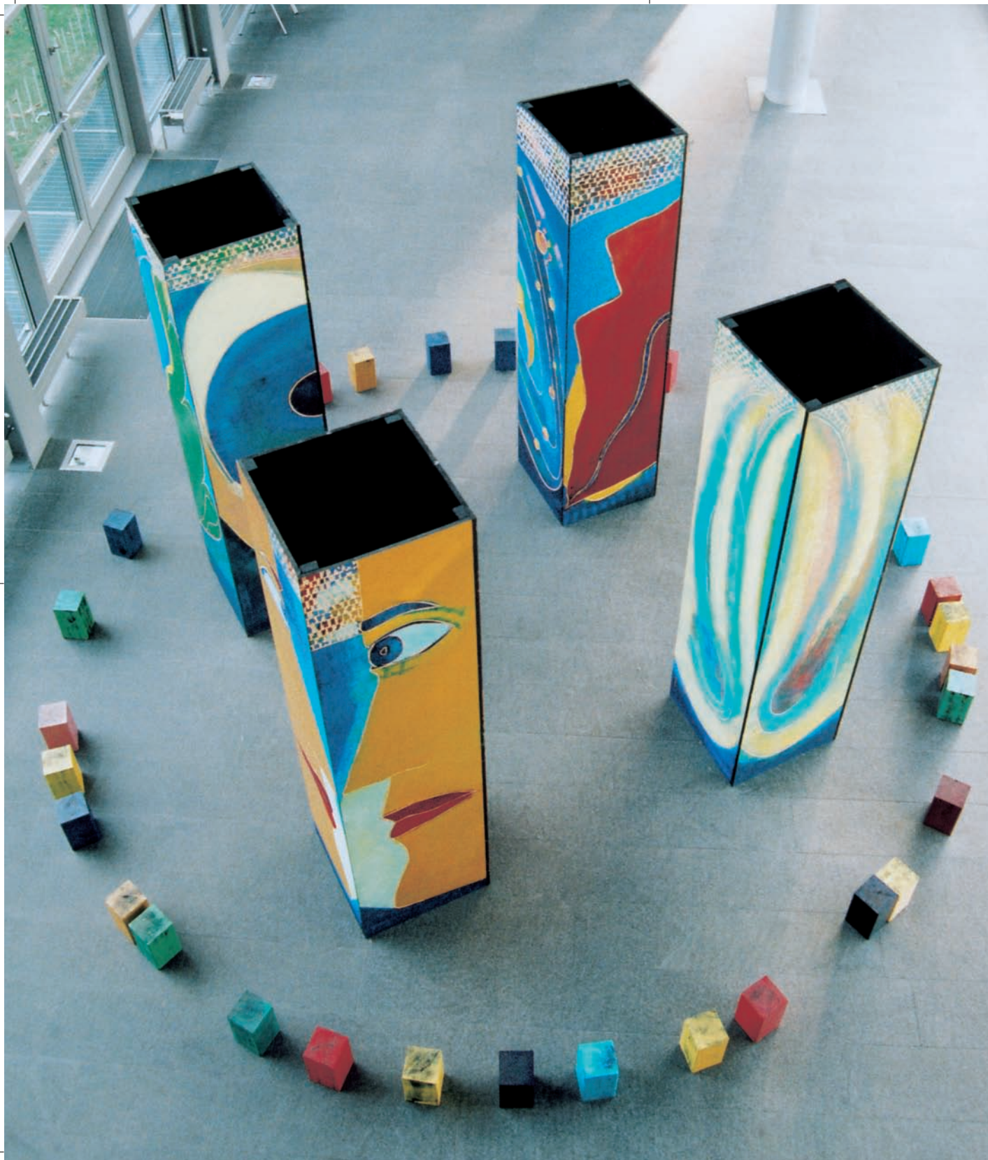
Ansicht der Objekte von oben